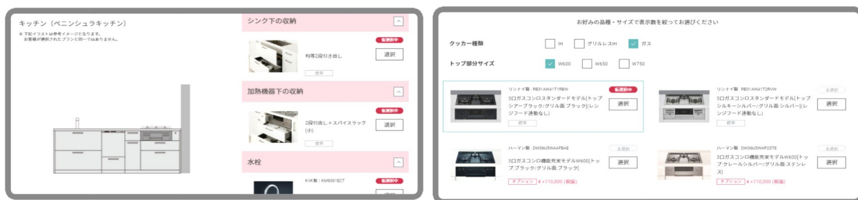
アイテム選択画面イメージ