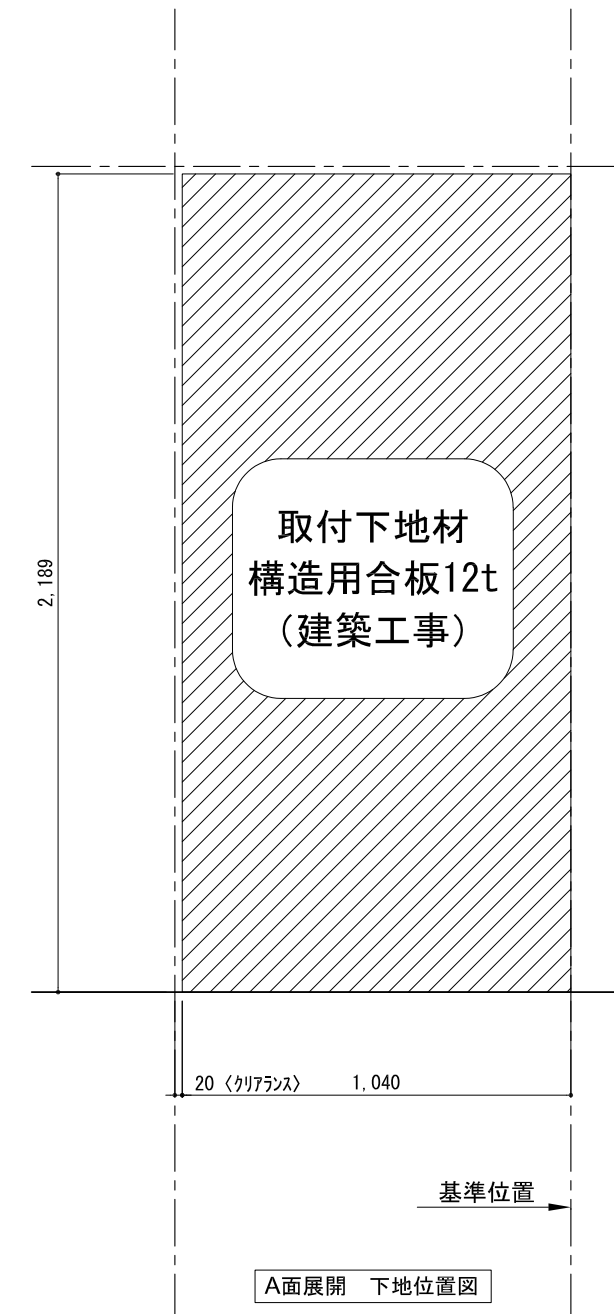
A面展開 下地位置図

備考欄/NOTE 1、仕様は改良のため予告なく変更することがあります。 2、取付壁面全面下地のこと。