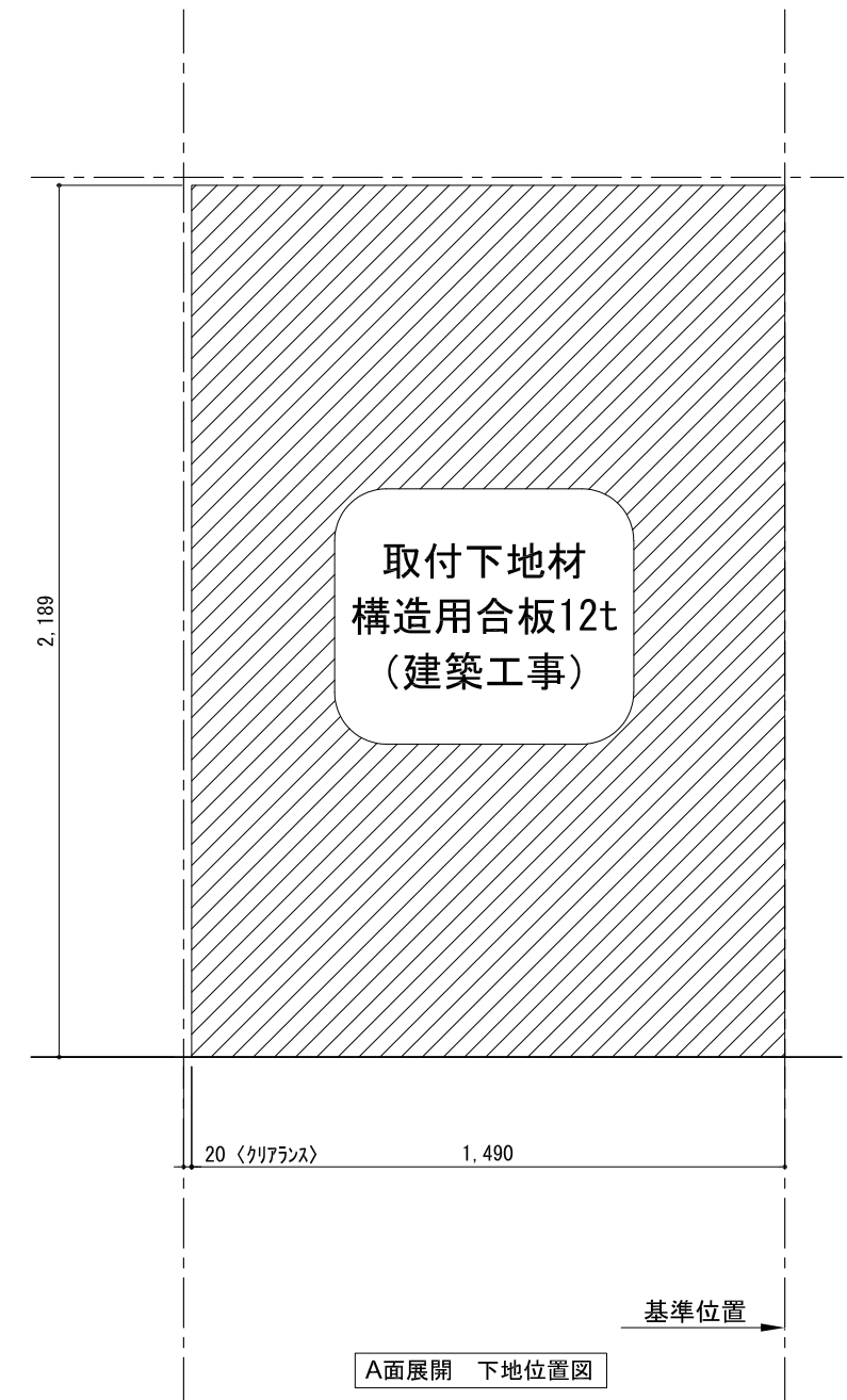
A面展開 下地位置図

備考欄/NOTE 1、仕様は改良のため予告なく変更することがあります。 2、取付壁面全面下地のこと。